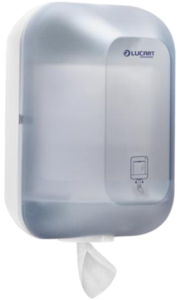
28-892287 L-One Maxi handpurrkuskammtari

Tandur býður upp á eftirfarandi vörur úr L-ONE línunni frá Lucart: