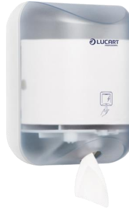
28-892288 L-One Mini WC skammtari