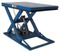
Vörulyftur &amp; lyftuborð