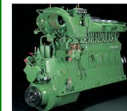
Skipavélar með gír 900 - 1100 hp