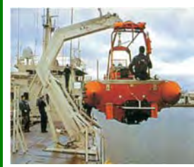
Davíður fyrir MOB báta