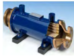
Olíu- & ferskvatns varmaskiptar