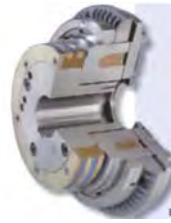
Vökva- & segulkúpl- ingar