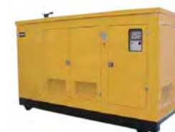
Hljóðeinangraðar 3 - 4500 kW