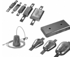
Zink &amp; fórnarskaut