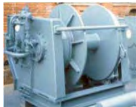
Trollspil Rafmagn - vökva