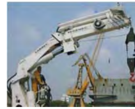
Dekkkranar Knuckle boom