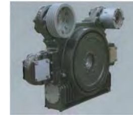
Milligífar—dæludrif 75 - 400 kW