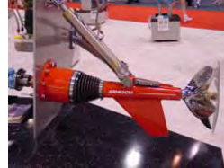
Yfirborðsskrúfur 100 - 10000 hp