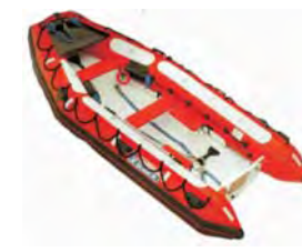
SOLAS MOB Bátar