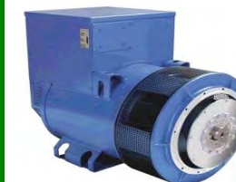
skiparafalar 20 - 3500 kW