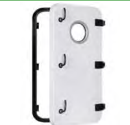
Plast- &amp; stálhurðar