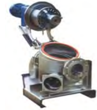
Hakkavélar & hakkavéladætur