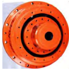
Sveigjutengi Vél í aflúrtak