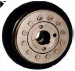
Sveigjutengi Öxull í öxul