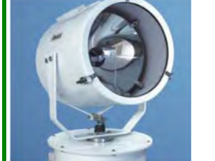
Ískastarar & leitarljós