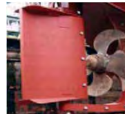
Sillingerstýri 1 - 10 m hæð