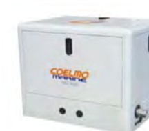
Hljóðeinangraðar 3 - 2500 kW