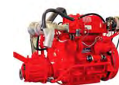
Smábátavélar 24 - 48 hp