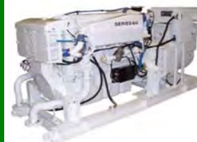
Sjórafstöðvar 3 - 3500 kW