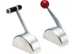
Stjórnþaki Barka - vökva - Rafmagn