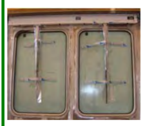
Gluggar & rúðuþurrkur