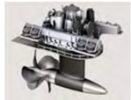
Vinkildrif upp að 1100 hp