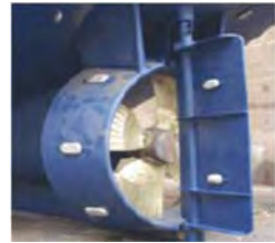
Skrúfuhringir 500 - 5000 mm