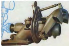
Þotudrif 150 - 2500 hp