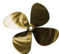
Fastar skrúfur 250 - 2500 mm