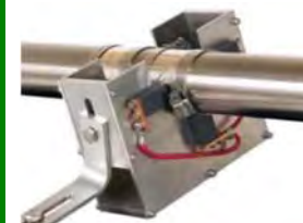
Tæringarvarnarskaut fyrir skrúfuása