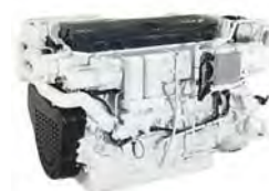
Bátavélar 100 - 825 hp