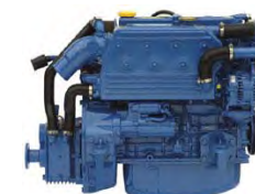
Trilluvélar 11 - 100 hp