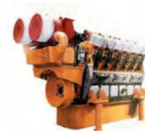
Skipavélar 2400 - 5000 hp