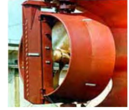
Skrúfustýrishringir 1 - 5 m skrúfubvermál