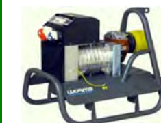
Traktorsrafalar 18 - 24 kW