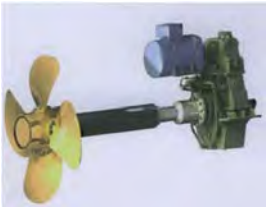
Skrúfubúnaður 5 - 6500 kW