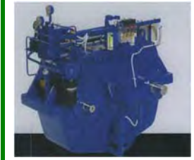
Aflurtaksgífar 500 - 3000 kW