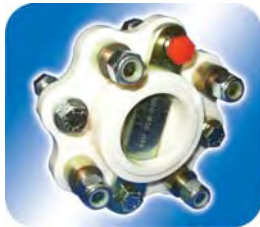
Sveigju- & öxultengi