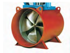
Hliðarskrúfur 3 - 3500 kW