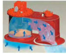
Steering grid 300 - 650 hp