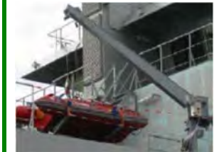
Kranar fyrir björgunarbáta