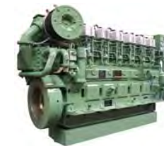
Skipavélar 1000 - 2400 hp