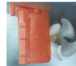
Flabsastýri 1 - 10 m hæð