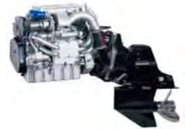
Hældrífsvélur 180 - 250 hp