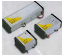
Invertar, hleðslutæki, rafgeymaainangrarar