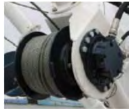
Krana &amp; bómuspil