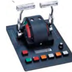
Stjórnúnaður Rafmagn - loft - vökva