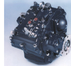
Bátagífar 20 - 750 hp