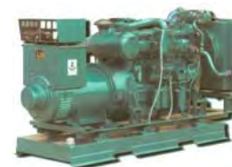
Landrafstöðvar 3 - 4500 kW