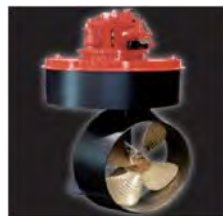
Vinkildrif 140 - 3800 kW