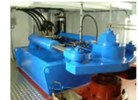
Stýrisvélur 1 - 15 tm