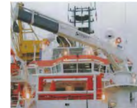
Dekkkranar Telescopic boom