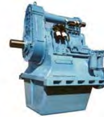
Niðurfærslugífar 500 - 6500 kW